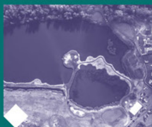
Pole Golfowe Armada w Bytomiu