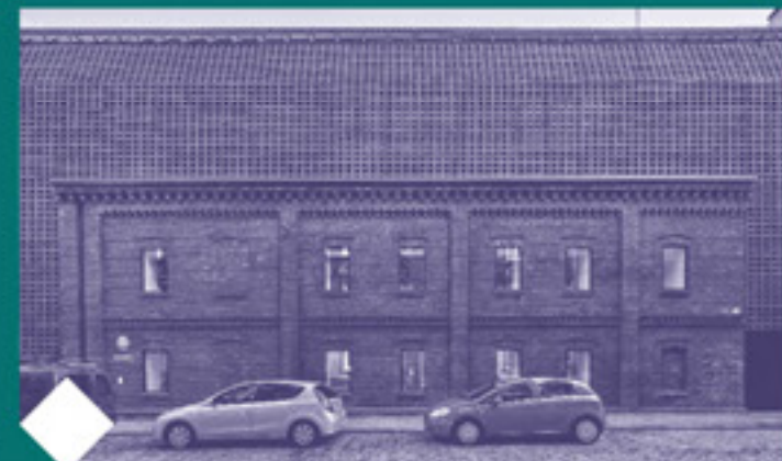
Wydział Radia i Telewizji Uniwersytetu Śląskiego