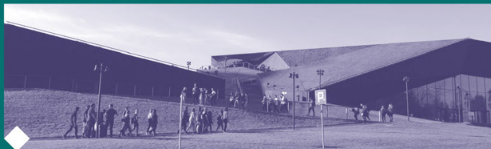
Międzynarodowe Centrum Kongresowe